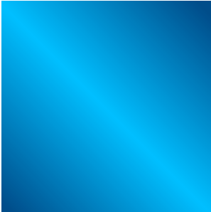
Verlauf 1, Matt:

Damit die Illustrationen auf dem Keyvisual besser zur Geltung kommen, leuchtet er als Background nicht so sehr wie die Bildmarke. Dieser Verlauf kann auch als Hintergrund anderer Gestaltungselemente verwendet werden.